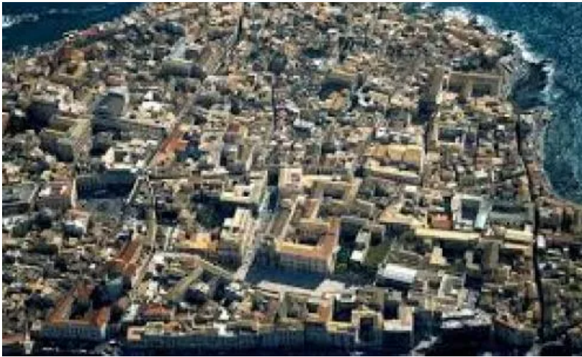
Siracusa ospiterà il Challenge Lab EIT Food dell'Unione Europea

si terrà a Siracusa, unica città italiana ad ospitare la due giorni di sfida, il Challenge Lab di EIT Food ,