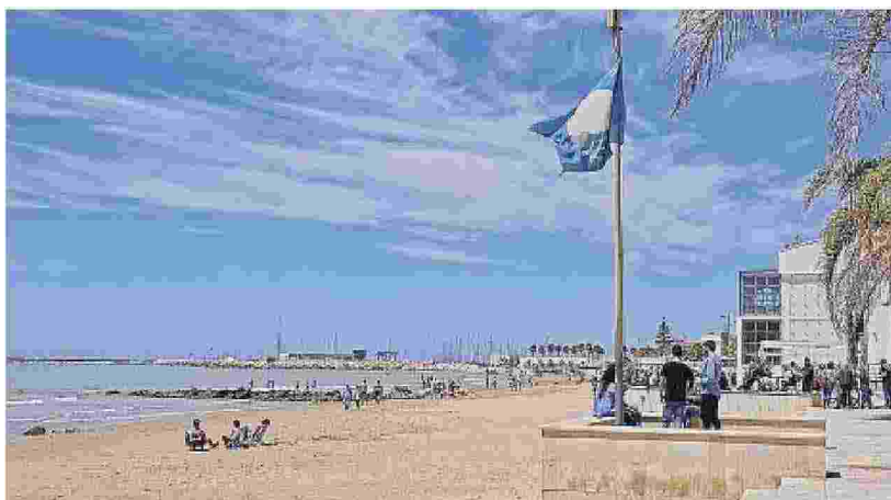
La cerimonia per la nuova Bandiera blu è in programma venerdì a Marina

Palazzo dell'Aquila infine ha evidenziato che per le chiamate di emergenza al presidio "Marina", è attivo il numero verde 800 896 997, operativo tutti i giorni compresi i festivi, dalle ore 9 alle ore 19. ●